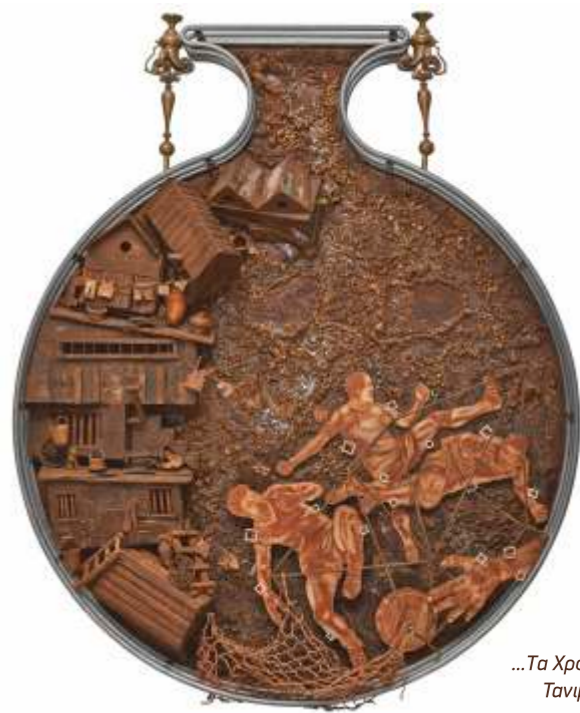
...Τα Χρόνια της Λάσσης... Τανιμανίδης, 2014